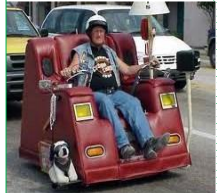
Alternative zum Bürgerbus?